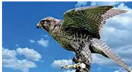
Falkner Show ab 18.00 Uhr

- pro Person im DZ 260 € - Einzelzimmerzuschlag 45 €