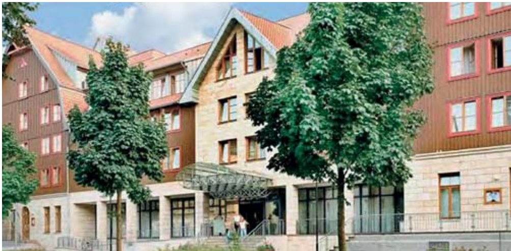
HKK Hotel Wernigerode