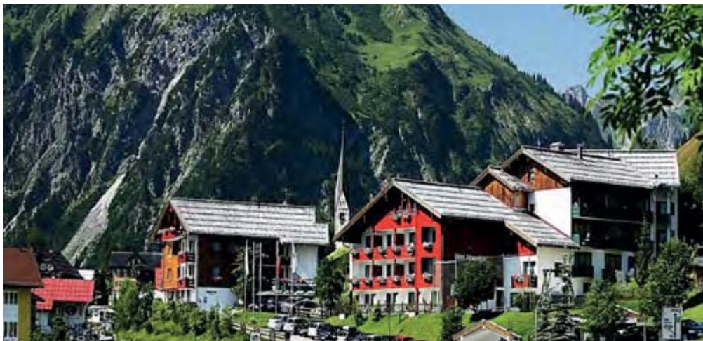
IFA Hotel Alpenrose - Kleinwalsertal