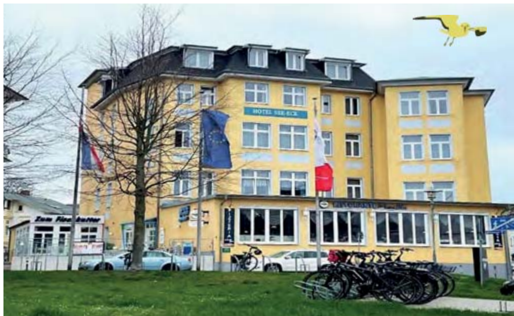
Das Hotel hat eine gute Lage.