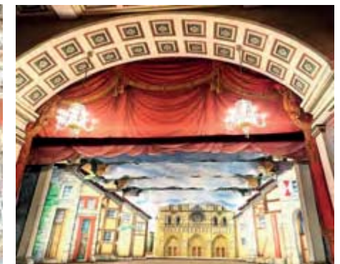
Ekhof-Theater aus dem 17. Jhd.