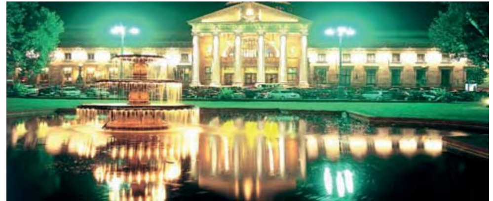
Kurhaus von Wiesbaden vom Schiff aus

„Unsere Tür steht offen, mehr noch unser Herz“ - nach diesem Wahlspruch der Zisterzienser agiert die Abtei des Klosters Eberbach seit ihrer Gründung durch Bernhard von Clairvaux im Jahr 1136. Inzwischen befindet sich das Kloster im Besitz einer gemeinnützigen Stiftung, die das kulturelle Erbe achtsam hütet und der Öffentlichkeit zugänglich macht. Das Kloster Eberbach ist neben Hotel und Weingut auch ein gern genutzter Schauplatz für Film und Fernsehen. „Der Name der Rose“ machte das Kloster weltbekannt, auch „Deutschland sucht den Superstar“ und „Bares für Rares“ wurden hier schon gedreht.