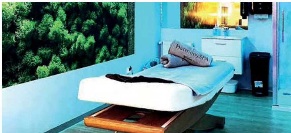
Behandlungsräume im Kurhotel Hamilton