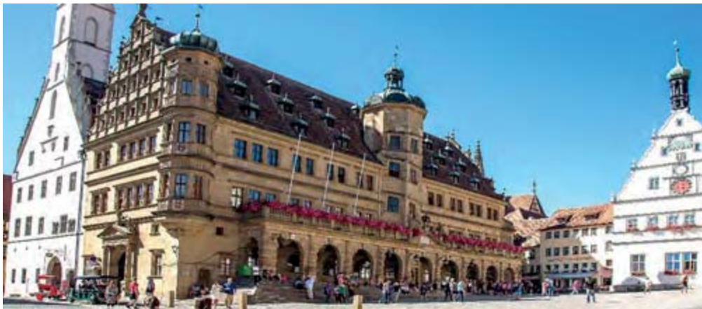
Rothenburg ob der Tauber