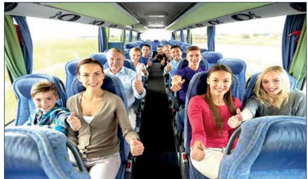
Bus fahren macht Spaß und gute Laune.

Mit uns können Sie sorglos und sicher reisen. Wir haben wieder viele schöne Reisen ins Programm aufgenommen, z. B. in das Kleinwalsertal in Österreich, eine schöne Reise an den Bodensee sowie unsere bekannten Badeurlaube und entspannte Kurreisen nach Kolberg oder Swinemünde sind auch dabei. Nur der volle Einsatz unseres Personals garantiert Ihnen eine tolle Busreise. Mit unserer Freundlichkeit bringen wir frischen Wind ins Busfahren ! Neu ist eine Reise nach Frankreich in das Disneyland Paris. Dort erwarten Sie zauberhafte Tage, in denen Sie alles auf eigene Faust erkunden können. Bei Buchungen bis zum 10.12.2024 sichern Sie sich 3 % Frühbucherrabatt. Schmökern Sie durch unseren druckfrischen Katalog und planen Ihre nächste Busreise mit Monikas Busreisen, ganz sorglos. Unser Team freut sich auf Sie. Wir danken Ihnen für Ihre Treue und freuen uns, Sie wieder zu begrüßen.