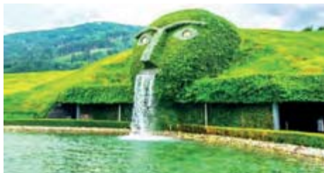
Swarovskis Kristallwelten & Wilder Kaiser