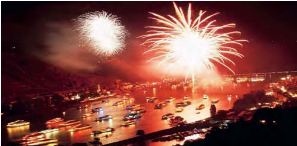
Rhein in Flammen Feuerwerk