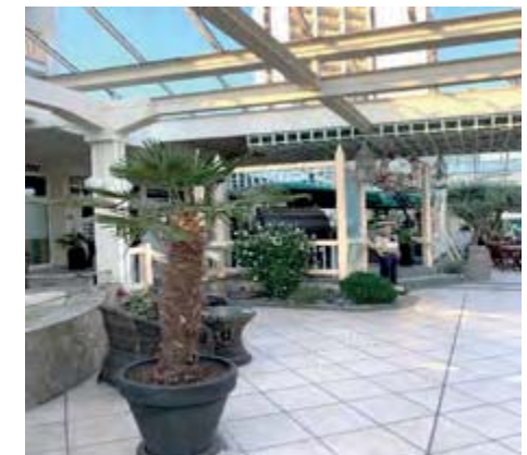
Wintergarten im Hotel