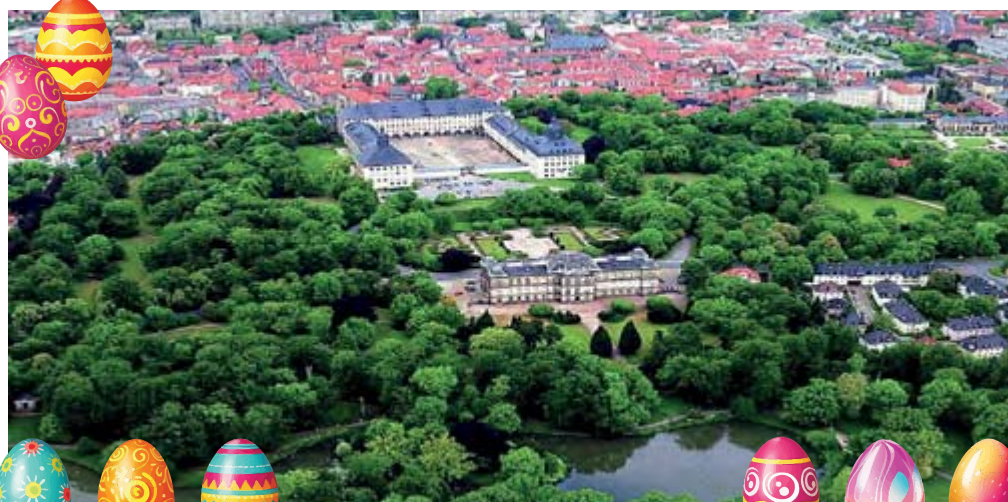
Blick auf Schloss Friedenstein in Gotha