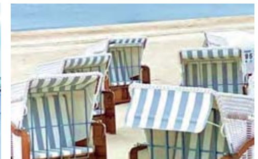
Strand in Heringsdorf