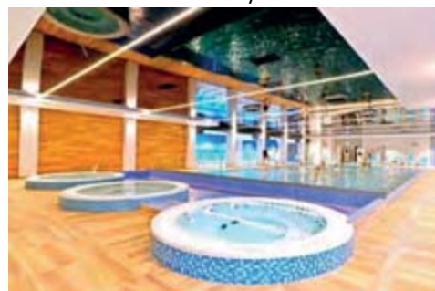
Schwimmbad mit Whirlpool