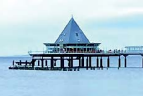
Seebrücke in Heringsdorf mit Restaurant