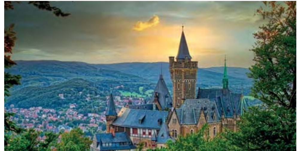
Schloss Wernigerode vom Agnesberg

Wernigerode bietet viele touristische Attraktionen. Der Stadtkern besteht zum großen Teil aus niedersächsischen Fachwerkhäusern. Das neugotische Wernigeröder Schloss thront markant über der Stadt & ist schon aus der Ferne gut zu erkennen. Auch die Umgebung von Wernigerode ist reizvoll: Hier startet die Harzer Schmalspurbahn, die über Schierke zum Brocken sowie quer über den Harz nach Nordhausen in Thüringen fährt. Im Jahr 2006 fand in Wernigerode die zweite Landesgartenschau Sachsen-Anhalts statt. Das Hotel HKK Wernigerode (Harzer Kultur- & Kongresshotel) befindet sich im Zentrum von Wernigerode. Das Luftfahrtmuseum Wernigerode zeigt 50 restaurierte Flugzeuge und Helikopter in vier Hallen auf einer Fläche von ca. 6000 Quadratmetern. Ausgestellt sind ferner Teile, Geräte und Ausrüstungen, darunter Schleudersitze, Cockpits und Navigationsinstrumente, Piloten-Ausrüstungen, Triebwerke und Flugzeugmodelle aus verschiedenen Ländern. Die Ausstellung befasst sich hauptsächlich mit der Fliegerei nach 1945. Zum Bereich Technik gehören auch restaurierte Automobile und ein Tauchgerät. Neben Großexponaten erläutern Schnittmodelle & Funktionserläuterungen die Fliegerei. Insgesamt sind rund 1000 Stücke zu sehen.