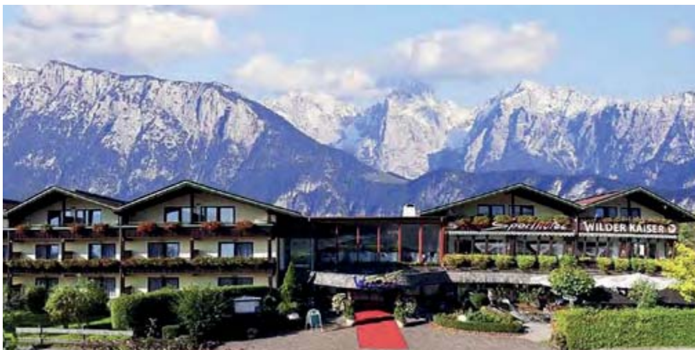
Hotel Wilder Kaiser in Oberaudorf