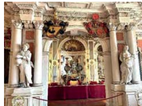
Frühbarocke Schlossanlage Schloss Friedenstein

Ostermontag: ERFURT Stadtrundgang durch Altstadt & Fahrt auf den Petersberg (Blick von oben) Zum Abschluss gehen wir in Erfurt zum Mittagessen im Hofbräuhaus am Dom. Danach Rückfahrt.